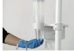
Wadah 3-in-1 Praktis Wadah 3-in-1 terdapat tissue box, tray, cup holder, Praktis dan Hemat Ruang.