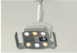
LED dental lamp Fokus jelas, Kecerahan, Opsi Temperatur Warna, Putih/ hangat/ Campuran yang dapat diatur.