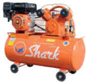
Terdapat kompresor sebagai sumber udara tekan untuk keperluan pengoperasionalan dental unit