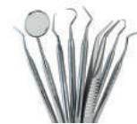
Terdapat scaler untuk menunjang pemeriksaan pada mulut pasien