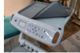
Wadah Peralatan Silikon Pad Silikon yang dapat di lepas pasang untuk pembersihan dan sterilisasi.