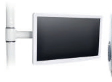
Terdapat monitor dan kamera oral yang digunakan untuk melihat kondisi mulut pasien