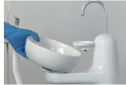
Tempat Meludah Detachable Bahan Ceramic, dapat berputar, dilepaskan, mudah untuk dibersihkan.