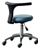
Terdapat kursi dokter gigi yang dapat digunakan oleh dokter, dengan desain yang dinamis.